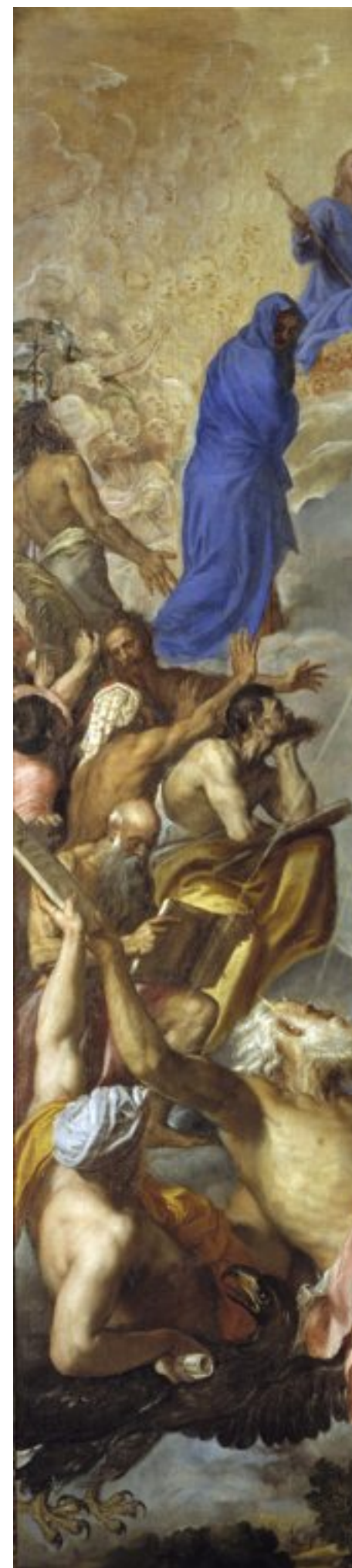
'Gloria' van Titiaan. © culture-images/hh

'Ook het argument op basis van finetuning is interessant. Dat argument zegt dat het universum zo afgestemd is dat leven mogelijk is. De kans dat er een kosmos is die leven voortbrengt, is ongelooflijk klein. Ongeveer zo klein als de kans dat je met een pijltje gooit naar een dartsbord ter grootte van onze hele kosmos, en net dat ene welbepaalde stipje raakt. Dat zijn