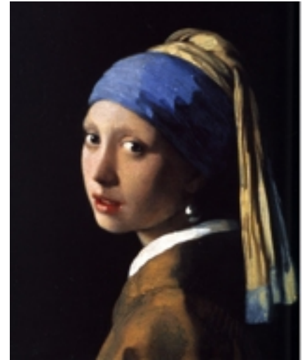
'Meisje met de parel'.

'Lolita is een rol die ik zelf zeer graag zou willen spelen. De periode van de jaren vijftig is ook compleet mijn ding. Waarom dragen we vandaag geen hartjeszonnebrillen meer?' (lacht)